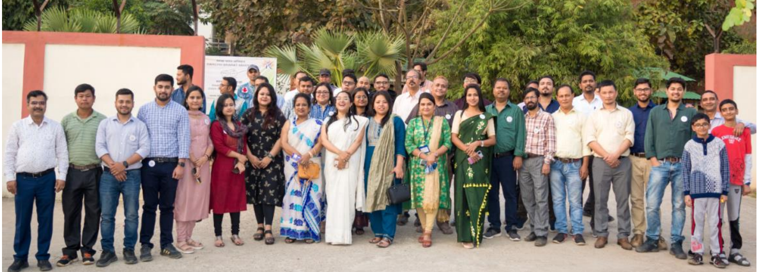
The organizing team of NSD 2023 at CPP-IPR