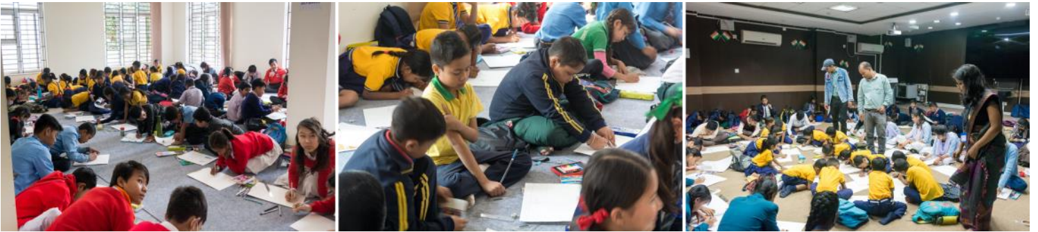
The drawing competition in progress.