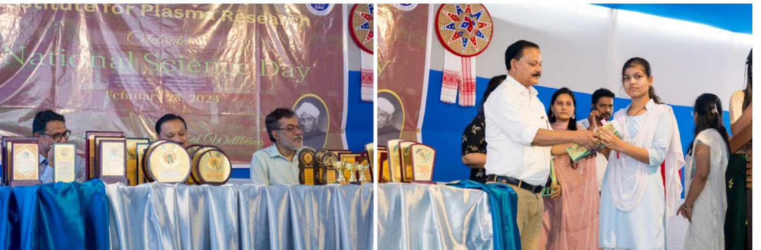
The NSD 2023 prize distribution