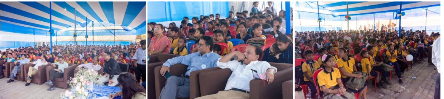
View of the audience