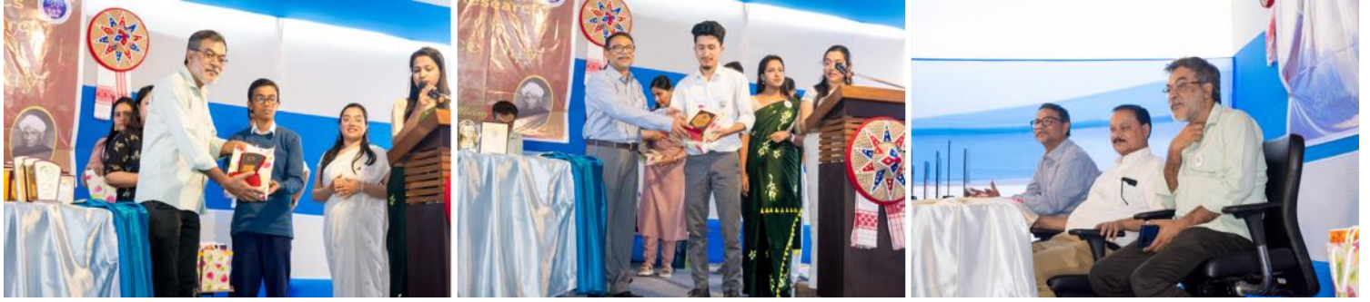
The NSD 2023 prize distribution